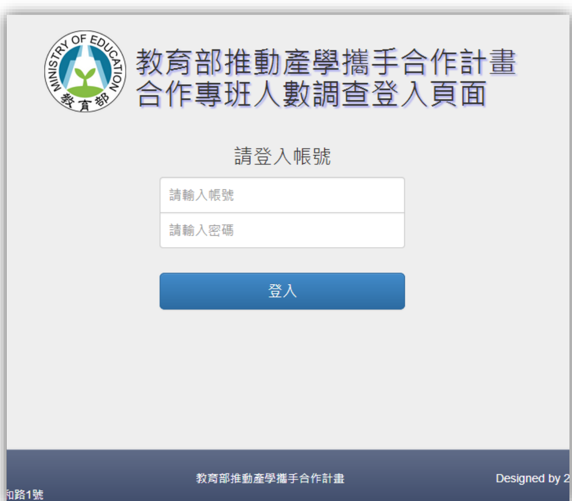
圖 三、系統登入頁面

本填報系統採用統一登入頁面，各填報學校之預設帳號密碼(系統預設一所學校一組)，已建置於系統中，使用提供之帳號密碼登入系統，即可開始使用