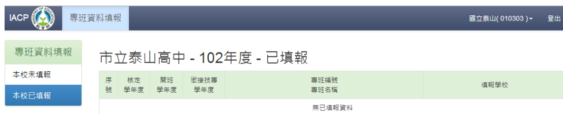
圖 二十一、已填報列表

系統顯示各校已填報之專班(包含當年填報及已結束之專班)，並可點擊專班名稱進入填報資料頁面(不可修改資料)