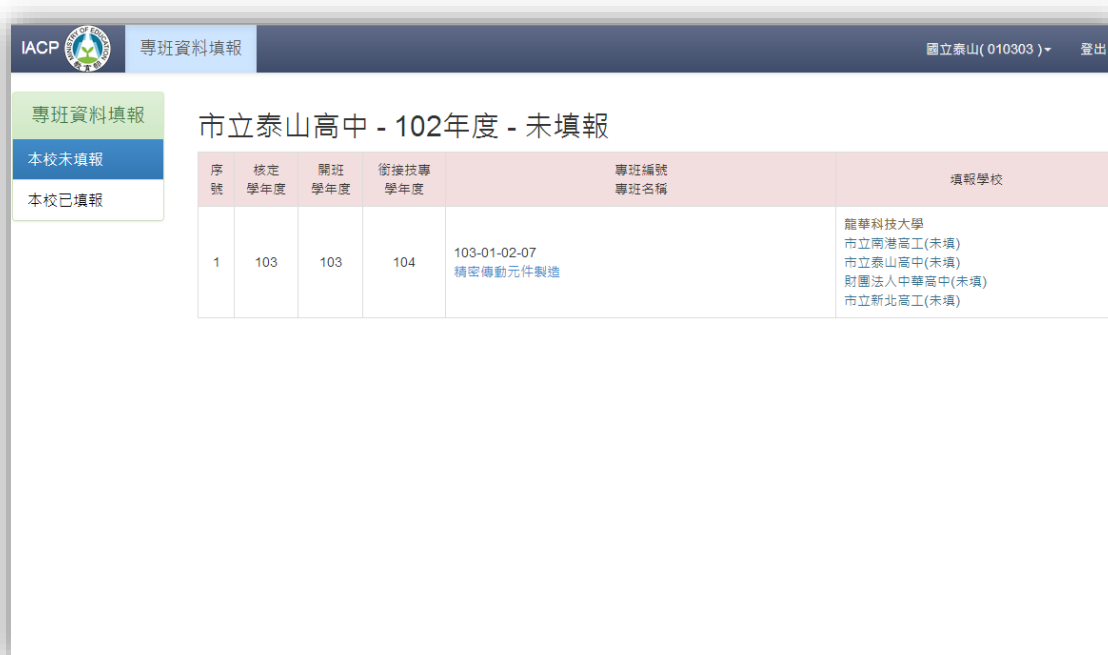
圖 十六、未填報列表