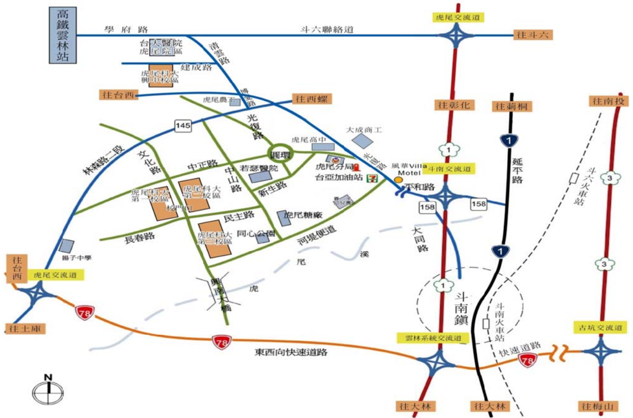
附圖：本校交通示意圖